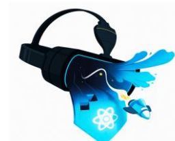
Option: RV / RA