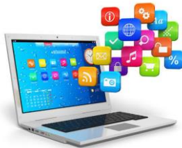
Option: Full Stack

3 options s'offrent au développeur digital pour se spécialiser: